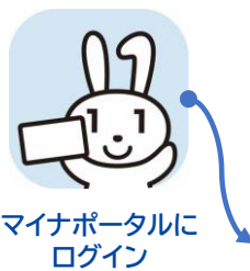
マイナポータルにログイン